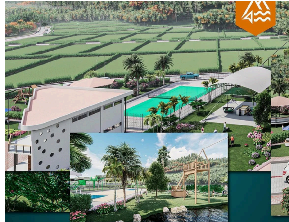
CANCHA MÚLTIPLE Y DE TENIS